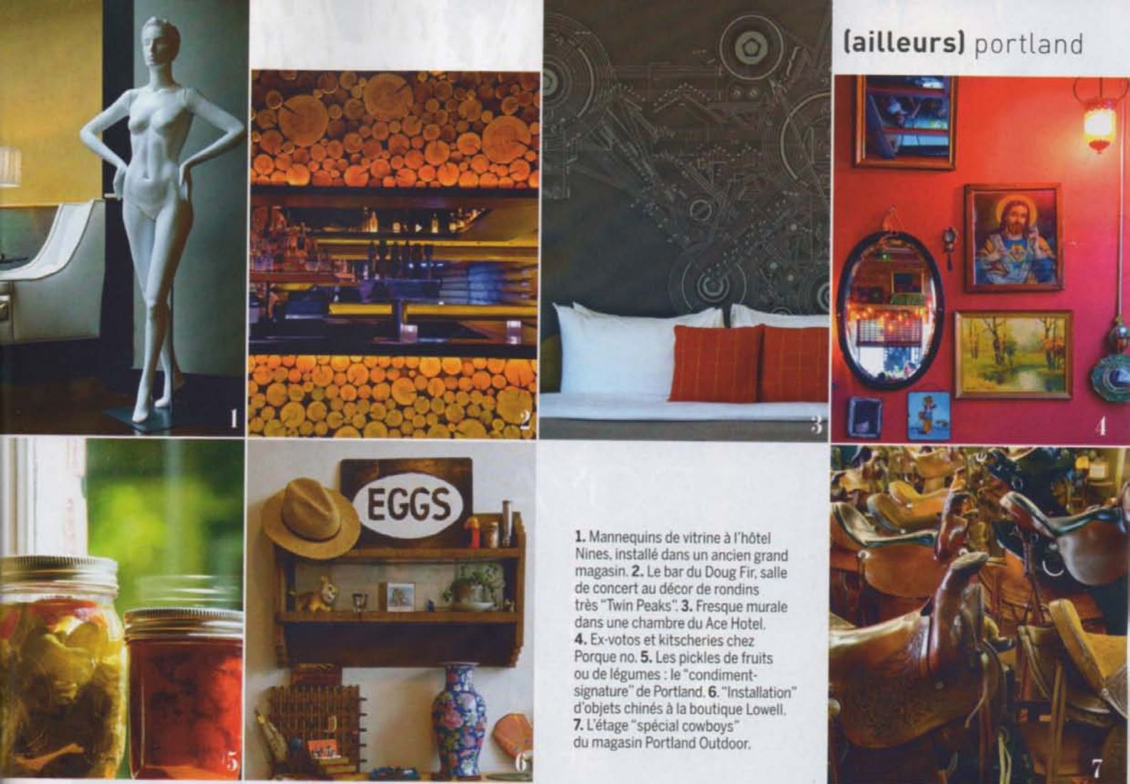
1. Mannequins de vitrine à l'hôtel Nines, installé dans un ancien grand magasin. 2. Le bar du Doug Fir, salle de concert au décor de rondins très "Twin Peaks". 3. Fresque murale dans une chambre du Ace Hotel. 4. Ex-votos et kitscheries chez Porque no. 5. Les pickles de fruits ou de légumes : le "condiment-signature" de Portland. 6. "Installation" d'objets chinés à la boutique Lowell. 7. L'étage "spécial cowboys" du magasin Portland Outdoor.

des "serapas" (tapis) mexicains ou les cocottes Heath, version vintage. 2710 N. Interstate Ave, (503) 367 32 30 http://beamananchor.com/